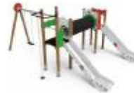
MULTISPORT 02 SPTMXT07*

*LAS ESTRUCTURAS DE COLUMPIOS ACEPTAN LAS COMBINACIONES DE LOS SIGUIENTES TIPOS DE ASIENTOS: